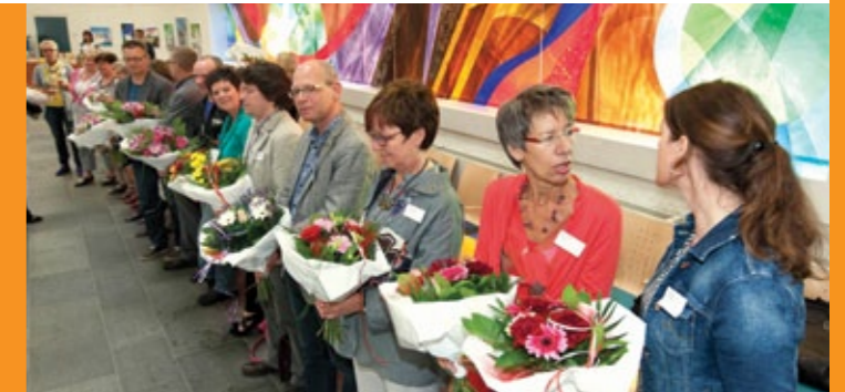
Tijdens de afsluitende conferentie van de S-factor op 5 juni 2012

De S-factor, het project dat eind 2012 formeel werd afgesloten, heeft waardevolle instrumenten opgeleverd die inmiddels volop in gebruik zijn. Deelnemers en projectleiders zijn zeer tevreden over dit resultaat. De subsidieverstrekker, het HPBO, bevestigde dit met een projectbeoordeling 'goed', de hoogste waardering en omschreef de projectaanpak als 'een parel'. Genoeg redenen om trots op te zijn!